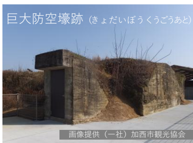
巨大防空壕跡 (きょだいぼうくうごうあと)